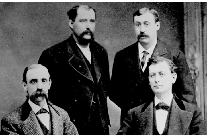
Esta foto é a única imagem que existe dos quatro fundadores da Kimberly-Clark juntos. Da esquerda para a direita, começando pela parte superior: Charles B. Clark, Frank C. Shattuck, Havilah Babcock e John A. Kimberly

Tratamos os clientes e fornecedores com justiça e somos responsáveis pela concorrência livre e justa. Fomos fundados na crença de que vivenciar nossos valores K-C representa uma vantagem competitiva, resultando em excelente qualidade e produtos inovadores com preços competitivos.